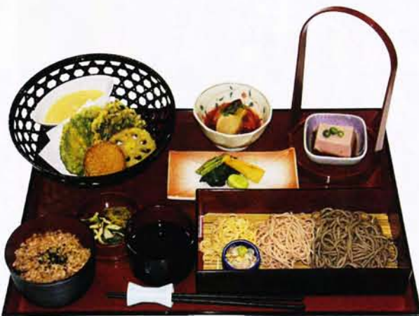
特別精進料理「そば御膳」 1,800円 (11:00より受付開始)

※ただし、四月二十六日〜五月六日の大型連休期間につきましては、価格や実施日の変更になる場合もありますので事前にお問い合わせ下さい。