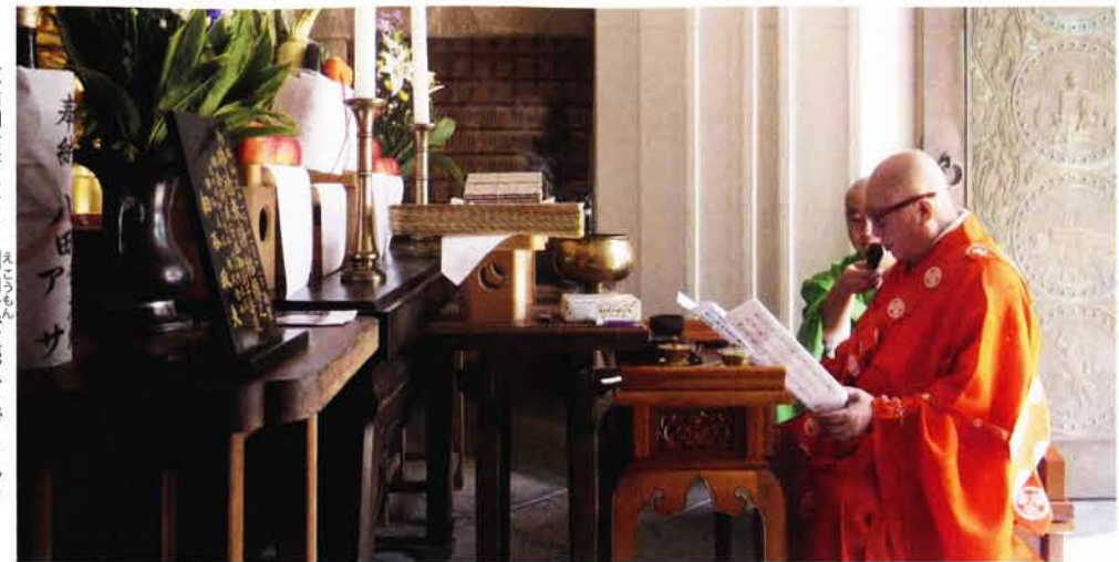
大山御眞首により回向文が読み上げられる