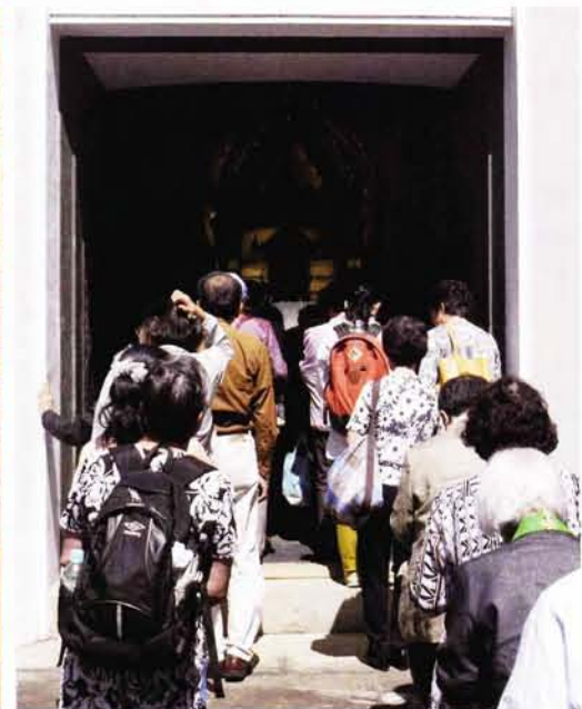
仏舎利塔内を参拝する参列の皆様