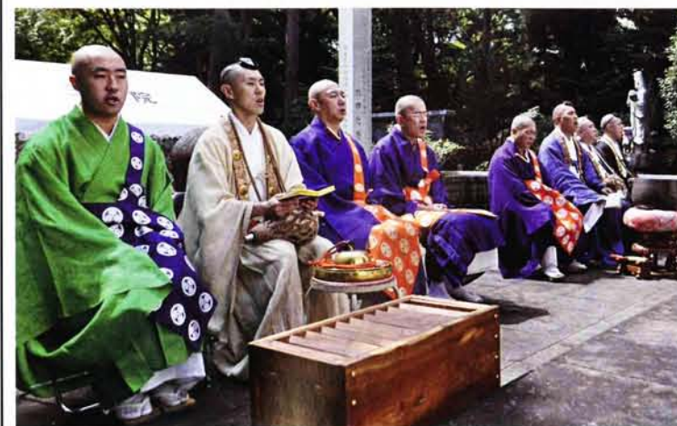
職衆の山伏・僧侶と共に御信徒の皆様が一心に祈りを捧げる