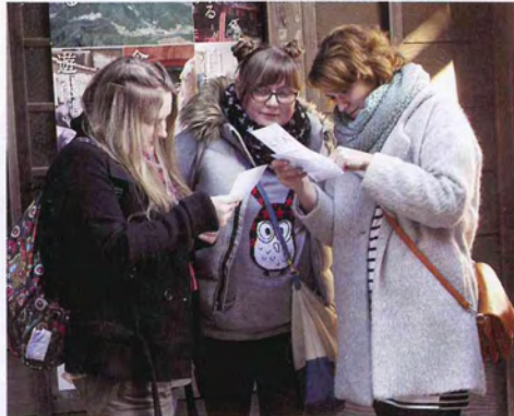
私の今年の運勢は…