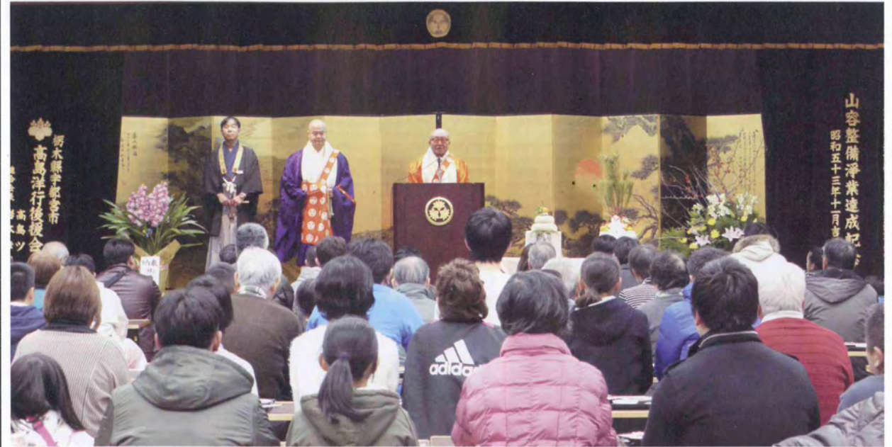
有喜閣の大広間では、大山御貫首の「乾杯」の発声と共に、お屠蘇膳を頂く