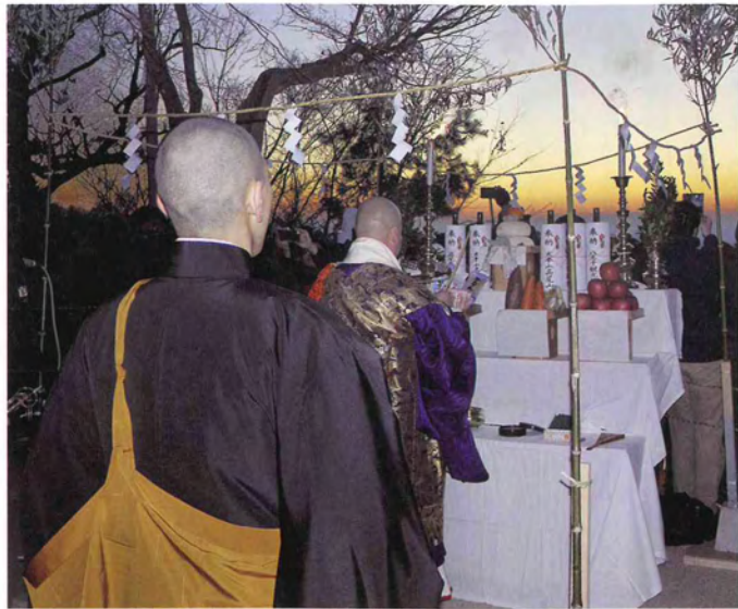
元日の山頂では迎光祭が執り行われる