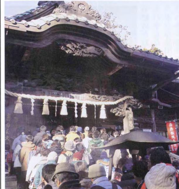
大勢の参拝者が大本堂をお参りする