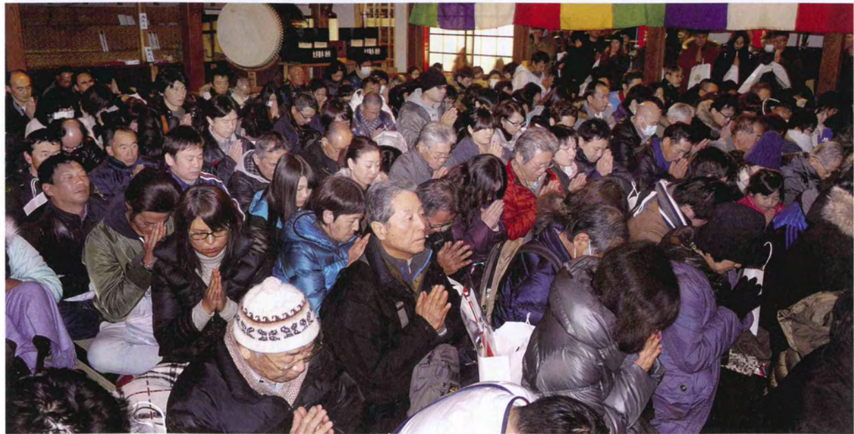
大本堂内へ訪れた大勢の御信徒の皆様が、御本尊様に熱い祈りを捧げる