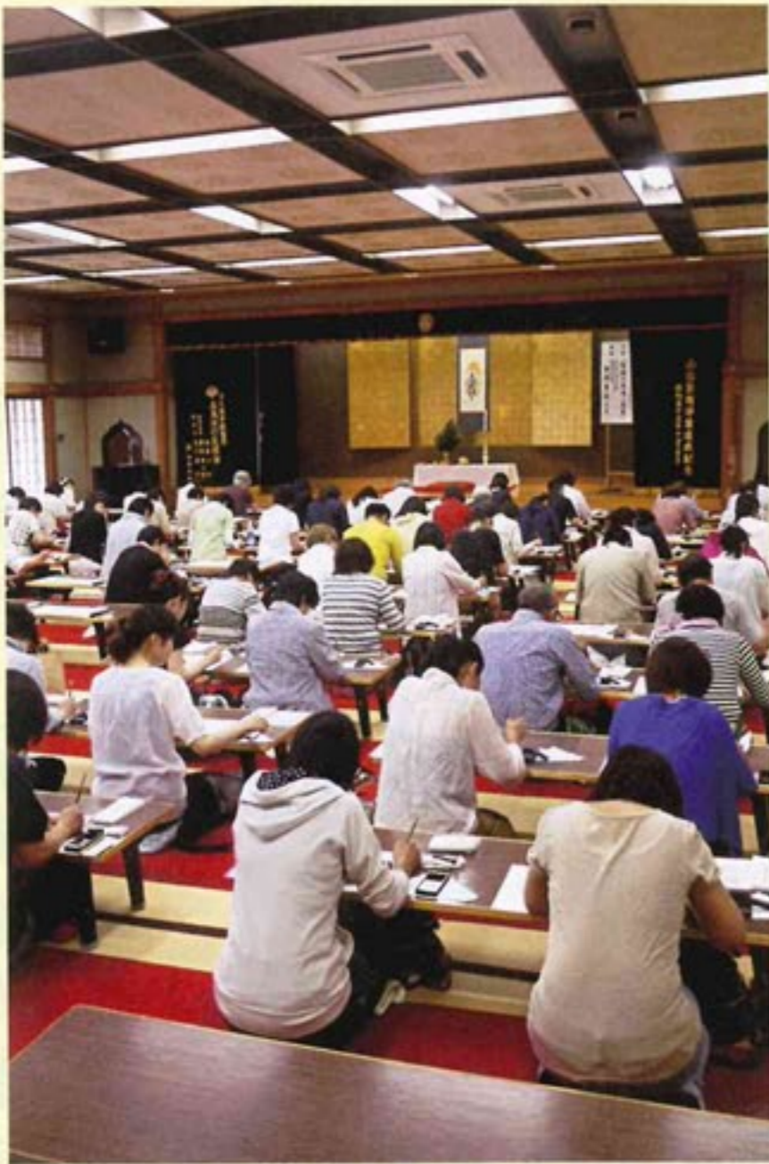
有喜閣での写経の様子

尚、写経に必要な諸道具は、当山にて用意致します。 誠に勝手ながら準備の都合上、お早めにお申込下さい。