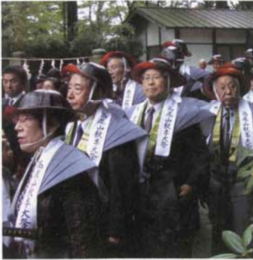
侍衣装を着た慶賛会の皆様

「物で米えて心で滅ぶ」という言葉は、昨今の世相を端的に表現しているようです。 経済発展の代償として、公害、交通禍、その他様々な弊害が生じ、経済的には豊かになりながらも、心は貧しく刺々しくなり、社会全体が人々の「迷いの心」で覆われております。このような時代にこそ、心に「うるおい」を与える信仰が必要であり、信仰の温かい心を通して愛情、尊敬、感謝などの心を養い、人間味豊かな社会を建立したいものと念願しております。 高尾山は現在「ミシユラン三ツ星を頂き、『心のふるさと折りのお山、世界に冠たる高尾の自然』と称せられ、多くの参拝者が来られています。 こうした恵まれた自然環境の中にある薬王院には、古来より僧侶だけではなく、広く一般からの篤志家が参加して行われる、多くの年中行事が伝承されております。高尾山慶賛会は、こうした各種の行事を奉賛し、以て御本尊を尊信し、その御加護を仰ぎ明るく温かく、そして豊かな生活を送ることを目的とするものであります。 ぜひとも茲に広く高尾山慶賛会員を募り、ご加入ご協賛を頂き、ご本尊様の威神力に浴されますよう念願するものであります。