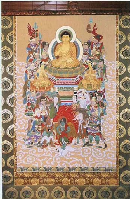
大般若経を守護する十六善神の図