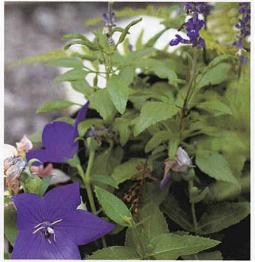
草花見て秋の気配を感じる

「ぞつとしない」という言い回しを、過半数が本来とは異なる意味で理解しているそうです。こうした結果に、文化庁は「時代の流れとともに本来の意味と違う使われ方が定着する場面も多い。一概に誤りだとは言えない」と語っています。 確かに、言葉は時代とともに変化していきます。「枕草子」や「徒然草」には、当時の言葉の乱れを嘆く一節がありますが、その時代の古語を、現代の