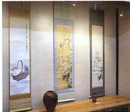
客殿会場展示の様子