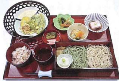
特別精進料理「そば御膳」 1,800円 (11:00より受付開始) ※料理の内容は季節や仕入れにより変わります ※写真は昨年の料理になります。

※ただし、春の大型連休期間につきましては、価格や実施日が変更になる場合もありますので事前にお問い合わせ下さい。