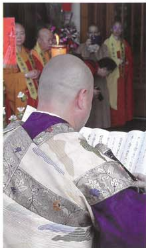
表白を奉読する飯沢執事