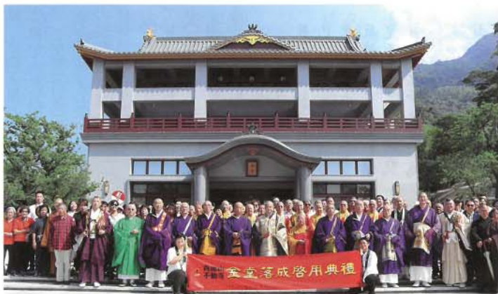
参列された不動寺関係者・檀信徒と共に新本堂落慶を祝い記念撮影